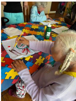
Figura 2. Oficina de pintura em tecido com os idosos, incentivando a criatividade e habilidades manuais.