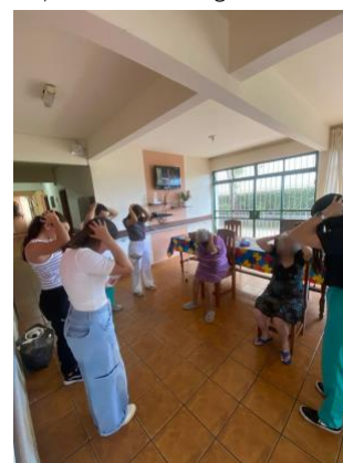
Figura 1. Extensionistas e idosos praticando alongamentos.

No quinto encontro, foi desenvolvida a atividade “ReciclArte: reciclagem e artesanato”, na qual os estudantes confeccionaram porta-retratos com papelão reciclável, que foram posteriormente decorados pelos idosos conforme suas preferências. O manuseio dos materiais reforçou a importância de estimular a coordenação motora fina na terceira idade, além de fomentar a criatividade e a expressão individual.