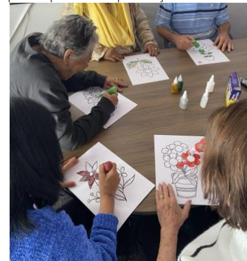
Figura 3. Grupo de uma das ILPIs participando de produções artísticas.

O sétimo encontro, “Exposição de arte”, propôs que os idosos decorassem imagens variadas com o uso de cola colorida. Ao final, as obras foram expostas como produções artísticas individuais. A ação promoveu a autonomia na escolha das imagens que mais representavam cada participante, além de desenvolver a coordenação motora fina durante a atividade de coloração.